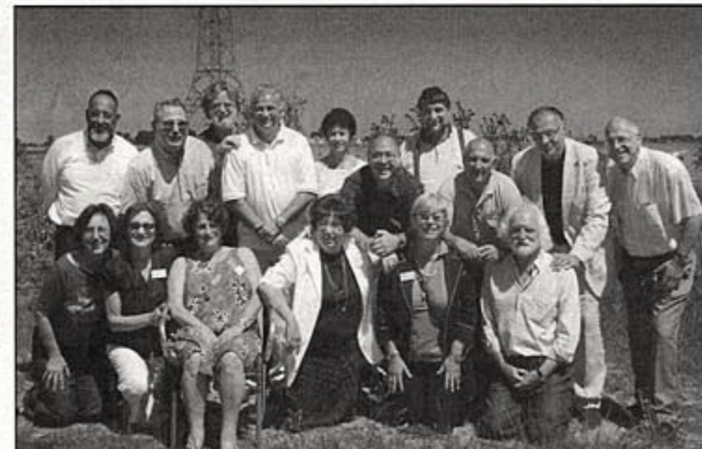
Groepsfoto van de zesde klas 1956/57, weer in dezelfde setting als op een originele foto.