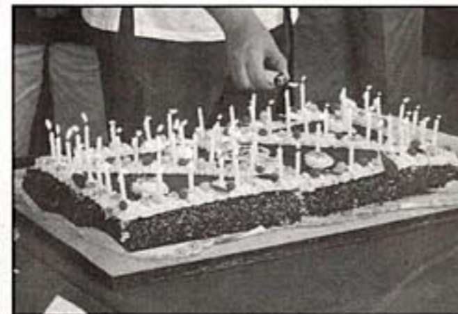
Zestig kaarsjes op de taart worden aangestoken: we gaan door tot 120!