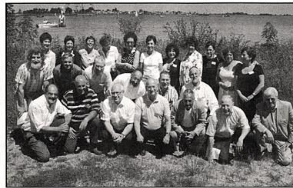
Groepsfoto van de vijfde klas 1956/57 in dezelfde opstelling als op een foto van vroeger.