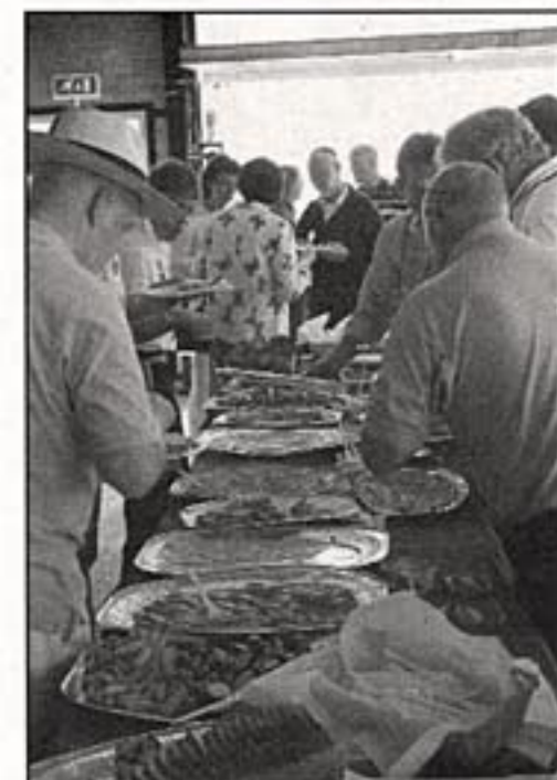
De gezamenlijke brunch is een compleet buffet.